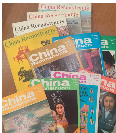
Рис. 2. Выпуски журнала разных лет. Библиотека ИВ РАН