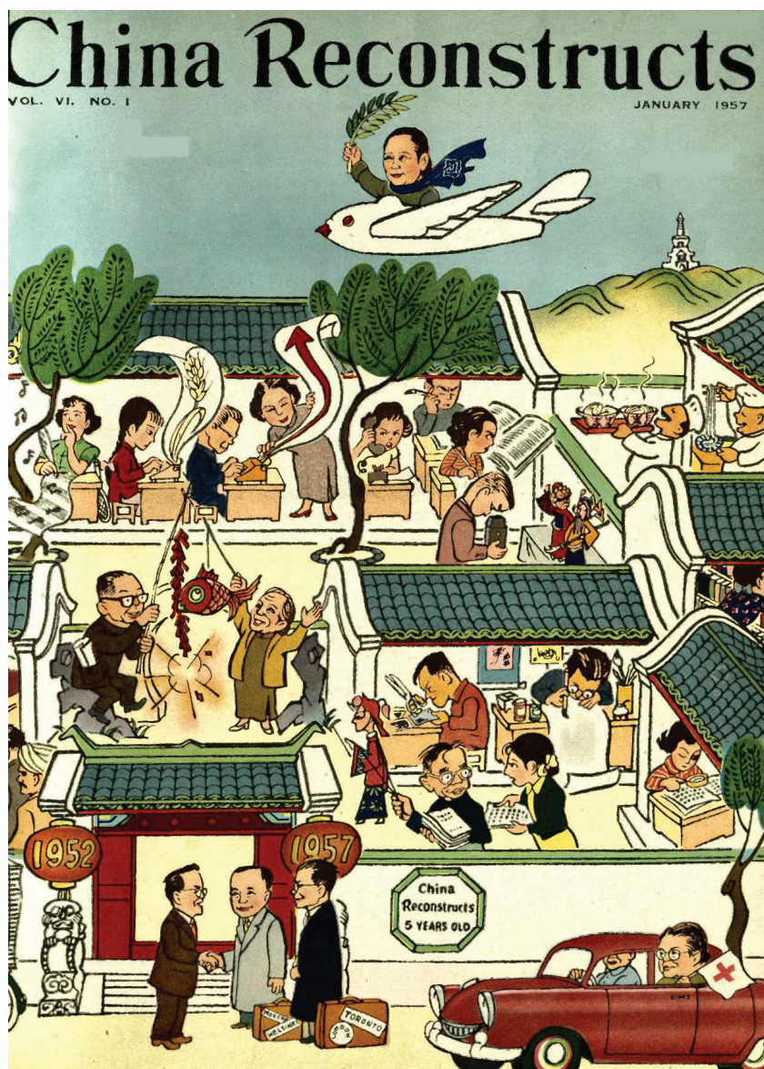
Рис. 1. Обложка журнала China Reconstructs . No. 1 (January), 1957