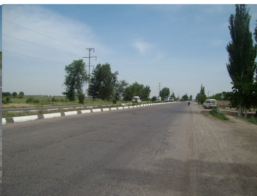
Рис. 4. Автомобильная дорога М-37«Самарканд-Ашхабад-Туркменбаши, 321-331 км»