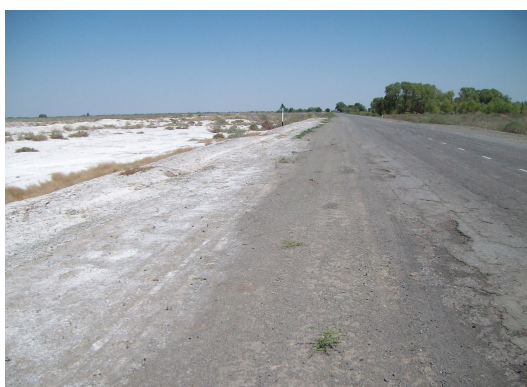
Рис. 3. Общий вид опытного участка на автодороге 4Р33 «Даштобод-Найман (Гулистон-Гагарин)»

2. В полевых условиях, на опытном участке построенного на автомобильной дороге в Сырдарьинской области - 4Р33 «Даштобод-Найман (Гулистон-Гагарин)» в сульфатно и хлоридно-сульфатно засоленных грунтах (рис. 3), а также на автомобильной дороге М-37 «Самарканд-Ашхобод-Туркменбаши» на участке 321-331 км, в хлоридно и сульфатно-хлоридно засоленных грунтах (рис. 4).