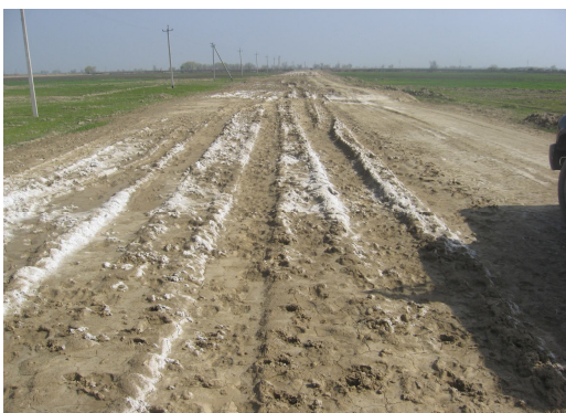
Рис. 1. Земляное полотно из засоленного грунта

Анализ литературных материалов показывает, что в засоленных грунтах земляного полотна очень часто встречаются: NaCl , Na_2SO_4 \cdot 10H_2O , MgSO_4 \cdot 7H_2O , MgCl_2 \cdot 6H_2O , CaCl_2 \cdot 6H_2O , NaHCO_3 , Na_2CO_3 \cdot 10H_2O , CaCO_3 , CaSO_4 \cdot 2H_2O и другие соли.