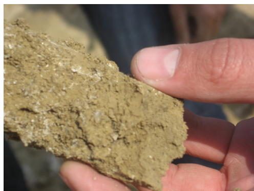
Рис. 2. Кристаллы соли в составе грунта

Засоленные грунты распространены в основном в сухих засушливых зонах и занимают 240 млн. гектаров площади всего земного шара. В странах СНГ засоленные грунты распространены в Казахстане, в республиках Центральной Азии, на территориях северно - восточного Кавказа и юго-восточной Украины, которые занимают в общем 120,8 млн. гектаров площади. В Узбекистане орошаемые земли занимают 1970,7 тысяч гектаров площади, 50% которых приходится на вновь осваиваемые земли. В частности, 75% земель засолены в различ-