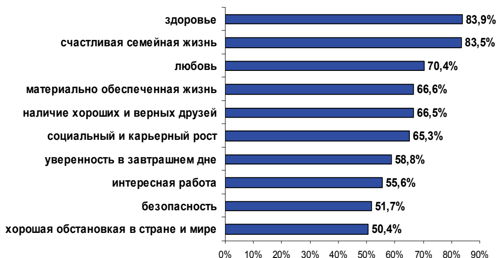
Рис. 2. Список ценностей, выбранных респондентами в 2009 г., в %

ности коллективистского общества оказались глубоко укоренены в общественном сознании, являясь содержательной основой и неустранимым стрержнем культуры» [11. С. 86].