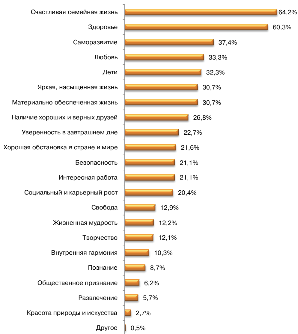
Рис. 1. Рейтинг ценностей респондентов, в %

Респондентам был предложен список из 21 наименования ценностей с просьбой выбрать из них только пять наиболее важных. Иерархию ценностей молодежи возглавили счастливая семейная жизнь (64,2%) и здоровье (60,3%); затем идут саморазвитие (37,4%), любовь (33,3%) и дети (32,3%); замыкает рейтинг ценностей познание (8,7%), общественное признание (6,2%), развлечения (5,7%), красота природы и искусства (2,7%) (рис. 1).