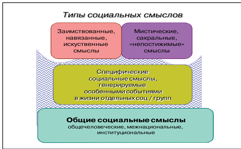
Рис. 1. Типы социальных смыслов

Допуская возможность типологизации социальных смыслов, мы можем графически отобразить их типы: традиционные/общие, ситуативные/специфические/институциональные, заимствованные/мистические/идеальные (рис. 1) [2].