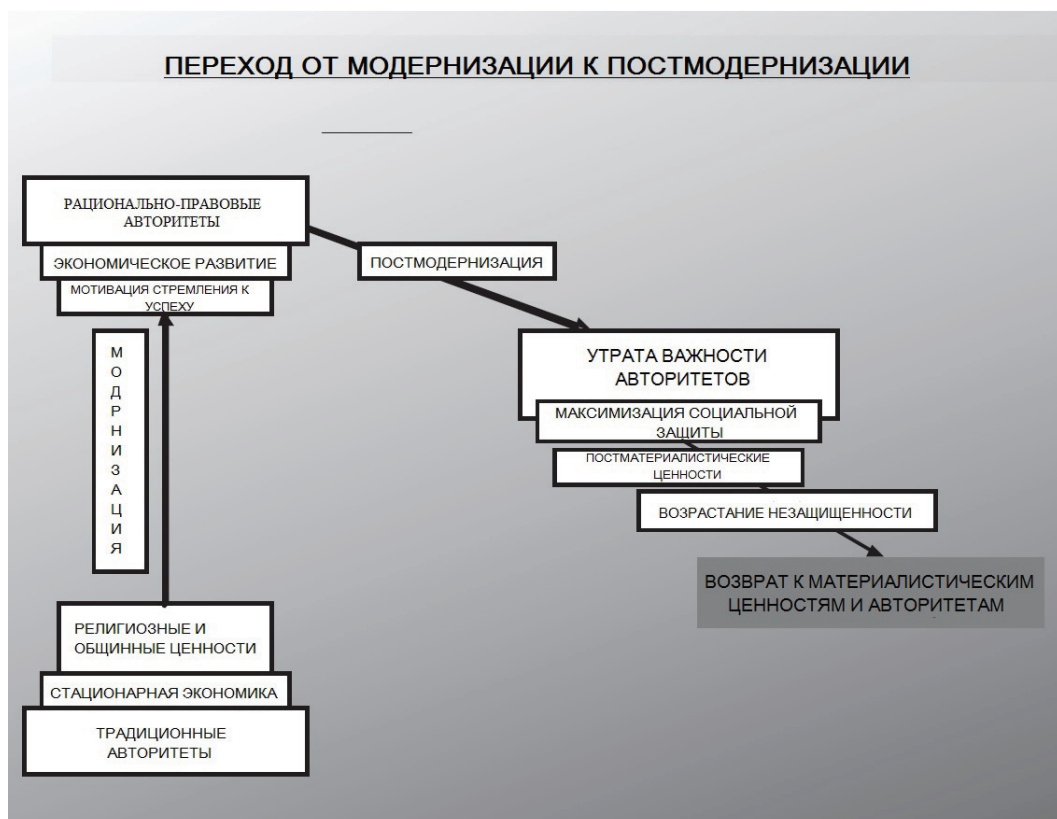
Рис. 4. Процессы модернизации и постмодернизации

Таким образом, согласно данным двум гипотезам, значение новых постматериалистических ценностей возрастает прямо пропорционально показателям экономического достатка и обратно пропорционально возрасту. Иными словами, по мере того, как страны и индивиды улучшают свое экономическое положение, доля населения, которая придерживается постматериалистических ценностей, увеличивается, и чем моложе индивиды (при неизменности всех прочих факторов), тем больше среди них доля тех, кто предпочитает постматериалистические ценности, и меньше доля тех, кто отдает приоритет материалистическим ценностям (рис. 4).