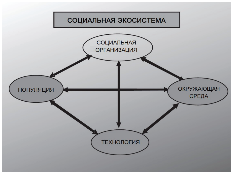
Рис. 1. Модель социальной экосистемы

Четыре элемента экосистемы взаимосвязаны, так что любое изменение, происходящее в одном из них, влияет на остальные и также может вызвать в них изменения. Всякая экосистема стремится к равновесию (демографическому, пространственному/территориальному, функциональному), но никогда не достигает его. Следовательно, любое равновесие нестабильно: в каждом из элементов происходят изменения, вызывая таковые в трех других.