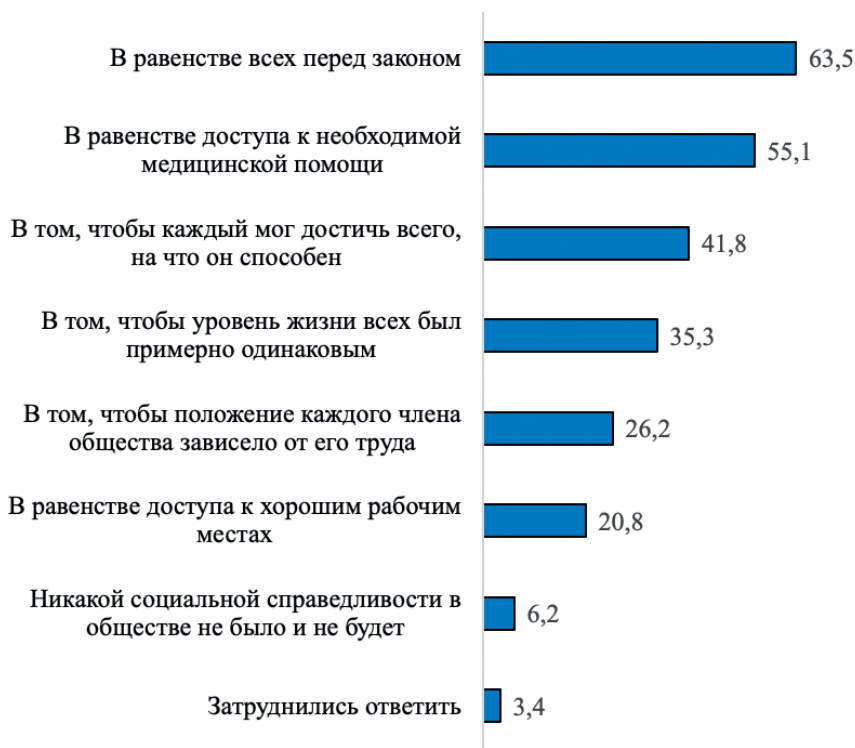
Рис. 3. Распределение ответов на вопрос «В чем, на Ваш взгляд, состоит социальная справедливость?» (2024, %)

до 24 лет (30%). Социальная справедливость как равенство возможностей самореализации чаще упоминается жителями областных центров и людьми в возрасте 45–65 лет, равный доступ к хорошим рабочим местам — более молодыми поколениями (25–30 и 36–44 лет — 25%).