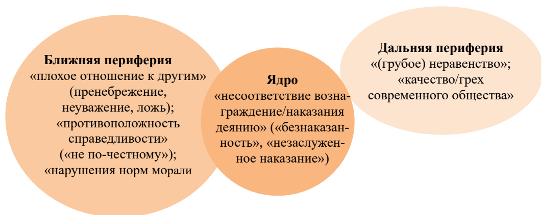
Рис. 4. Ядро и периферия образа несправедливости

тивных характеристик (коварен/лжив/жесток и т.д.) — 28 % против 17 %; однако у родителей пустой оказалась зона «аутсайдеров»: принижение и использование других людей (0 против по 7 %), а также игнорирование их интересов (0 против 11 %).