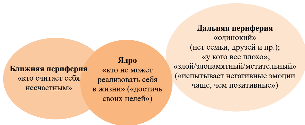
Рис. 2. Ядро и периферия образа несчастливого человека

зитивные») — 11 % (Рис. 2). Для юношей более важна «объективная» сторона несчастья — когда у человека «все плохо» (18 % против 12 %), он «беден» (5 % против 1 %), для девушек — «субъективная»: одиночество (18 % против 12 %), преобладание негативных эмоций (9 % против 4 %) и отсутствие любви (3 % против 0); для родителей — отсутствие любви (6 % против 1 %) и «когда все плохо» (20 % против 10 %), для «детей» — личная нереализованность (46 % против 34 %).