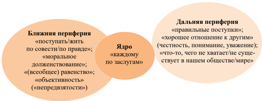
Рис. 3. Ядро и периферия образа справедливости

«Ядро» образа справедливости формирует понятие «каждому по заслугам» (37 %), его «ближнюю периферию» — честность («поступать/жить по совести/по правде» — 21 %; важнее для женщин — 18 % против 11 %), «моральное долженствование» (18 %), «(всеобщее) равенство» (прав, возможностей, благ, перед законом — 17 %; важнее для мужчин — 18 % против 11 %) и «объективность» («непредвзятость») — 11 %; «дальнюю периферию» — понятия правильных поступков (8 %), «хорошего отношения к другим» (честность, понимание, уважение) — 6 %, а также трактовки справедливости как «чего-то, чего не хватает/не существует в нашем обществе/мире» (6 %) (Рис. 3).