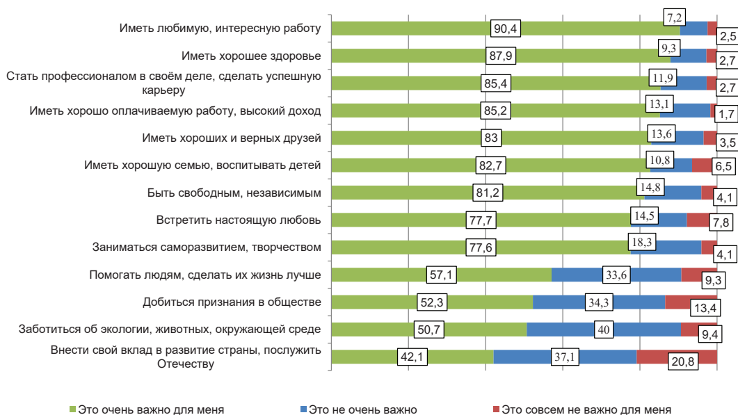
Рис. 1. Распределение ответов на вопрос «Что для Вас наиболее важно в будущей жизни?» (в %)

Сопоставление ответов молодежи и выпускников университета — как наиболее образованной, рефлексивной и открытой культурным влияниям ее части — позволяет увидеть интересные различия. Ответы респондентов на вопрос «Что для Вас наиболее важно в будущей жизни?», полученные в рамках опроса молодежи, представлены на Рисунке 1: в «топ-5» наиболее значимых ценностей входят: желание иметь любимую и интересную работу (90%), хорошее здоровье (88%), стремление стать профессионалом в своей сфере, сделать успешную карьеру (85%), желание иметь хорошо оплачиваемую работу, высокий доход (85%), а также иметь хороших и верных друзей (83%). Все это ценности индивидуально-эгоистические, сформированные «на стыке» дискурсов успеха и самореализации. Ценность дружбы в данном случае следует интерпретировать как индивидуалистическую — как один из индивидуально-значимых ресурсов защиты от одиночества и психологической поддержки, что подтверждается материалами фокус-групп: «Безусловно, люди, которые меня окружают, поддерживают в трудные моменты» . Интересно отметить, что хотя ценности семьи и воспитания детей оказались столь же значимы, как и дружба (83%), в отношении семейных ценностей почти вдвое больше респондентов выбрали вариант «это совсем неважно для меня» (6,5% и 3,5%).