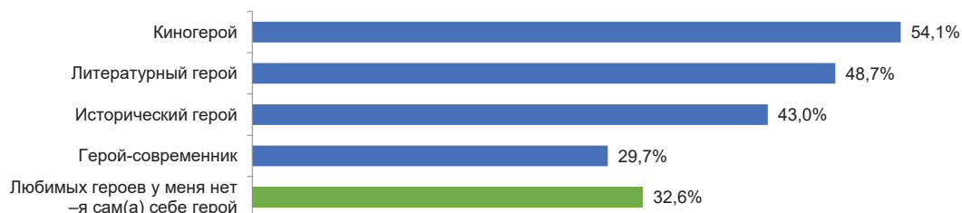
Рис. 2. Распределение ответов на вопрос «Есть ли у Вас любимые герои?»

ли и полководцы, Петр 1, Екатерина Великая, Суворов, Жуков; среди героев-современников — кто-то из родителей или близких родственников, прадедушек-участников войны и Путин. Обобщенные (без персонификации) ответы на этот вопрос представлены на Рисунке 2. Обращает на себя внимание количество респондентов, выбравших вариант «любимых героев у меня нет — я сам(а) себе герой» — 33 %: за 5–8 лет этот показатель вырос в 1,5 раза (2013 — 18–19 %, 2017 — 21–23 %).