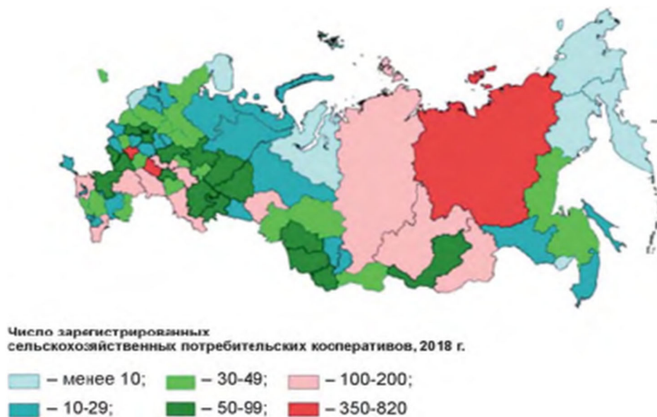
Рис. 1. Число сельскохозяйственных потребительских кооперативов на 1 января 2018 года (по данным государственной регистрации)

Когда мы говорим о российских сельскохозяйственных кооперативах, нельзя забывать об аграрно-региональном разнообразии нашей страны. К сожалению, статистика российской сельскохозяйственной кооперации в региональном разрезе неполна и фрагментарна. Например, если мы посмотрим на карту зарегистрированных сельскохозяйственных потребительских кооперативов по субъектам Российской Федерации (Рис. 1), то обнаружим, во-первых, сильную региональную дифференциацию, во-вторых, скромные показатели потребительской кооперации в регионах Северо-Запада.