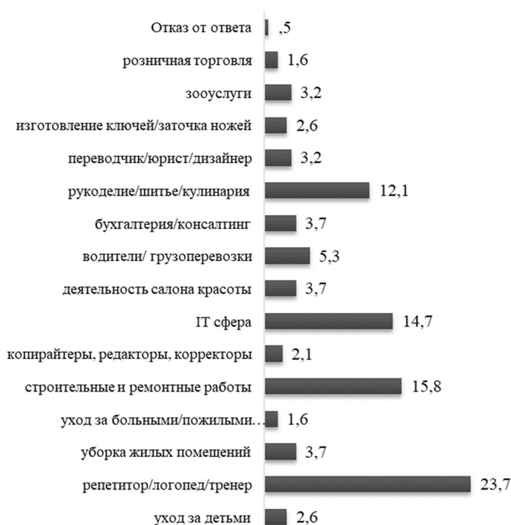
Рис. 2. Виды деятельности самозанятых (%)