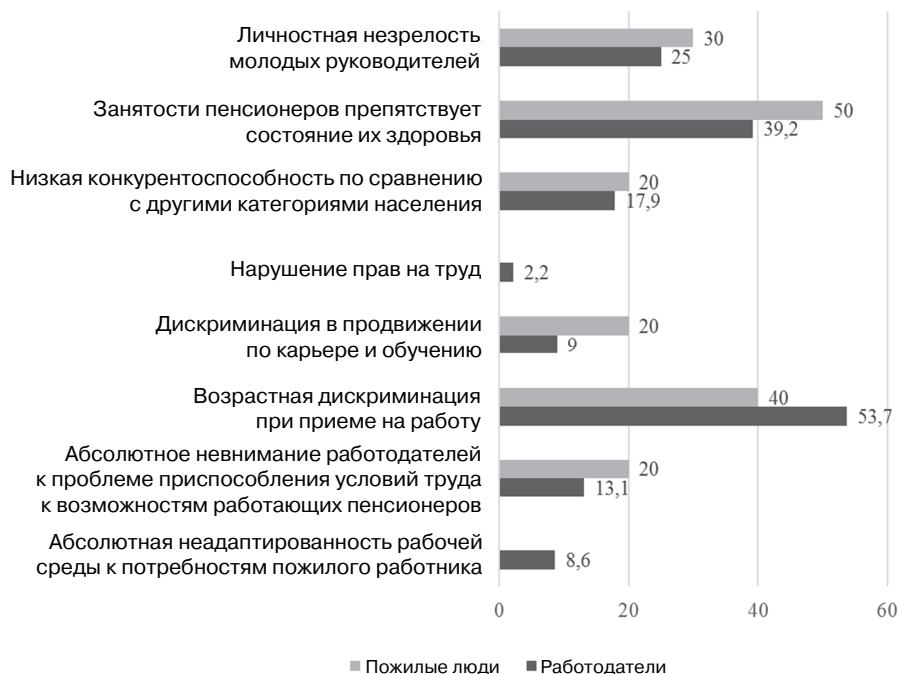
Рис. 1. Мнения пожилых людей и работодателей относительно внешних депривирующих факторов пожилых людей в сфере социально-трудовых отношений (в %)