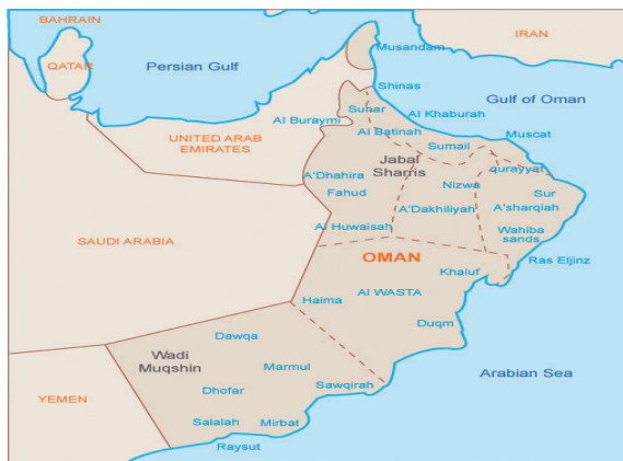
Рис. 1. Административное деление Омана

Султанат Оман делится на административные единицы — мухафазы, или провинции, за которыми закреплены названия — Дофар , Маскат , Мусандам , Северная аль-Батына , Южная аль-Батына , Северная аль-Шаркия , южная аль-Шаркия , аль-Дахилия , аль-Захира , аль-Бурейми , аль-Вуста (см. Рис. 1). Сравнительный анализ их семантики показывает, что эта группа топонимов, во-первых, образует систему, для установления и понимания которой необходимо также учитывать крупнейшую горную гряду Омана аль-Хаджар الحجر al-hajar (на карте обозначена его наивысшая точка Джабаль Шамс), во-вторых, образна, в-третьих, строится на антропоморфическом сравнении. Если горы аль-Хаджар в буквальном переводе ‘хребет’, то провинция аль-Батына الباطنة al-baatunah , лежащая к югу от него, — ‘подбрюшье’. Это следует из сравнения с животом بطن batan . Провинция аль-Захира الظاهرة al-dhaahirah , тянущаяся к востоку от этого хребта, являет собой спину (от араб. ظهر dhahr ‘спина’). Соответственно, по отношению к ним в пространстве аль-Вуста الوسطى al-wustaa ‘центральные районы’ (от араб. وسط wasat ‘середина’), аль-Дахилия الداخلية al-daahiliyyah ‘внутренние районы страны’ (от араб. داخل daakhila ‘внутри’), аль-Шаркия الشرقية al-sharqiyyah ‘восточные районы’ (от араб. قرشلا ash-sharq ‘восток’).