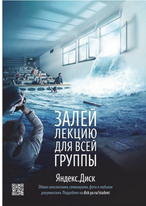
Рис. 2. Поликодовый текст печатной рекламы «Яндекс. Диск»

стиля. Очевидно, что перевод вербального компонента с французского языка должен содержать больший объем исходного текста, чтобы иметь возможность показать игру слов, а также определенный уровень осведомленности реципиента о внешнеполитической ситуации во Франции времен правления Франсуа Олланда.