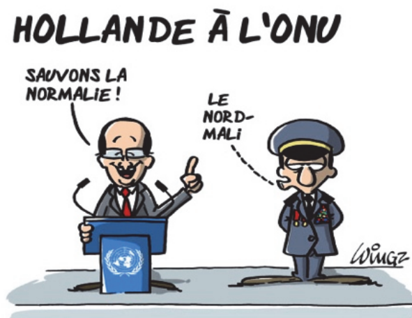
Рис. 1. Поликодовый текст политической карикатуры Hollande à l'ONU (Олланд в ООН)

Приведем два примера рецепции и анализа поликодового текста разных жанров с некоторыми пояснениями.