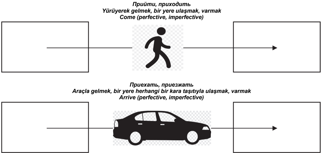
Рис. 1. Глаголы движения с приставкой при- Figure 1. Verbs of motion with prefix при- ( pri- )

На стадии введения глагола желательно использовать схемно-графическую и предметно-изобразительную наглядность, что способствует адекватному восприятию и пониманию значения новой единицы, ее обобщенному представлению. Примеры использования наглядности представления глаголов движения с приставками при- и под- продемонстрированы на рис. 1 и 2.