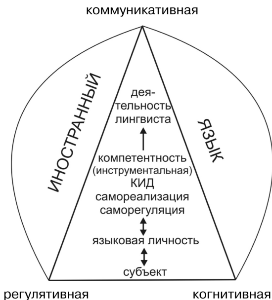
Рис. 2. Функции контрольно-измерительной деятельности

ковой личности, как пластичность, способность к саморазвитию, умение сочетать родную культуру с культурой других народов (когнитивный компонент); на субъектов общения (коммуникативный компонент).