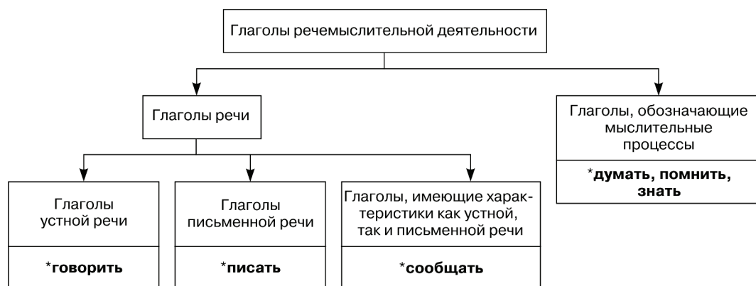
Рис. 1. Учебно-методическая классификация глаголов РМД