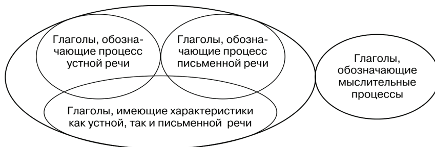
Рис. 2. Лексико-семантическая группа глаголов речемыслительной деятельности

Структура ЛСГ глаголов РМД представляет собой четыре взаимосвязанные подгруппы (рис. 2), имеющие ядерную, полярную структуру, в центре которой находится базовый идентификатор, а остальные глаголы распределяются в области ближней и дальней периферии.