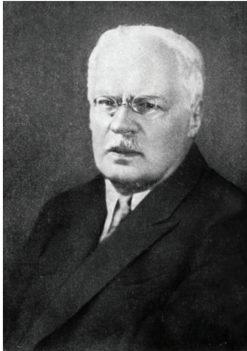
Фото 1. Востоковед, тюрколог В. А. Гордлевский (1876–1956) Photo 1. Orientalist, Turkologist V.A. Gordlevsky (1876–1956)

преподавал турецкий язык и историю турецкой литературы в Лазаревском институте, который позднее был реорганизован в Московский институт востоковедения, с 1918 г. – занимал должность профессора Переднеазиатского института. С 1925 по 1929 гг. – профессор Московского государственного университета, преподавал также на восточном факультете Военной академии РККА имени М. В. Фрунзе. В 1934 г. получил степень доктора литературоведения, в 1946 г. был избран академиком Академии наук СССР.