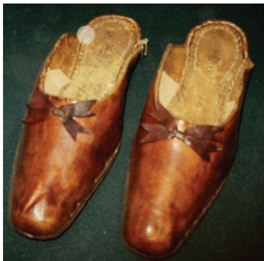
Фото 2. Женские туфли «терлик» без задников и каблуков. Сафьян, кожа. Длина пришивной подошвы – 25,5 см Photo 2. Women's shoes "terlik" without backs and heels. Fur, leather. The length of the sewing soles is 25.5 cm

стали развитыми и оживленными центрами торговли в Крыму. Основными предметами реализации, связанными с изготовлением и использованием обуви, были местные и импортные товары: кожи, сафьян, овчина, растительные красители и глины, клей (сапожный животного и растительного происхождения), фурнитура и т.д. 51 .