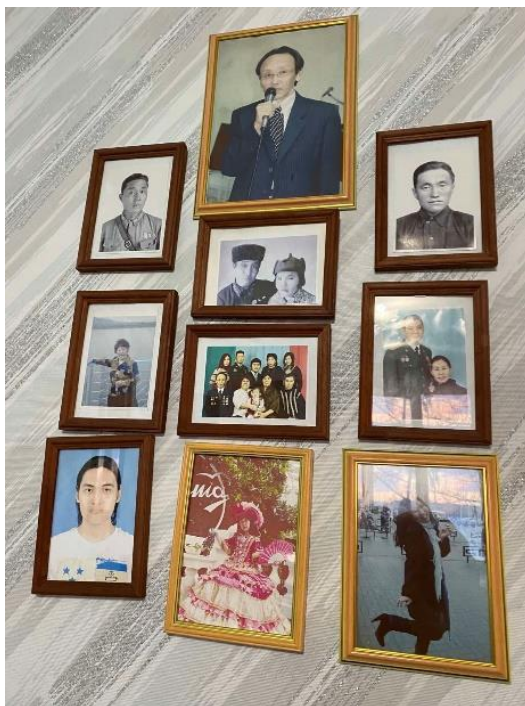
Рис. 2. Типичный домашний фотостенд семьи тувинцев-горожан Figure 2. A typical home photo stand of a Tuvan city-dwelling family

Мы полагаем, что это новация прижилась и стала массовой, поскольку она заменила у тувинцев «красные уголки», в которых раньше стояли религиозные буддийские изображения, предметы 12 . Соседства семейных фотографий с богами практически никто не помнит. Наличие специальных алтарей с культовыми предметами в юртах тувинцев исследователи связывают с влиянием буддизма. Тем не менее в традициях шаманизма, добуддийской религиозной системы тувинцев, также было подобное – на решетчатой стене юрты висели изображения духов-покровителей 13 . Поэтому в жилищах всегда были сакральные места. В связи с запретом религии в советское время держать открыто предметы культов дома «красные уголки» заменили фотографии. Самыми ценными были черно-белые, портретные фотографии родителей, бабушек, родившихся на рубеже XIX–XX вв., возможно, единственные, сделанные при их жизни.