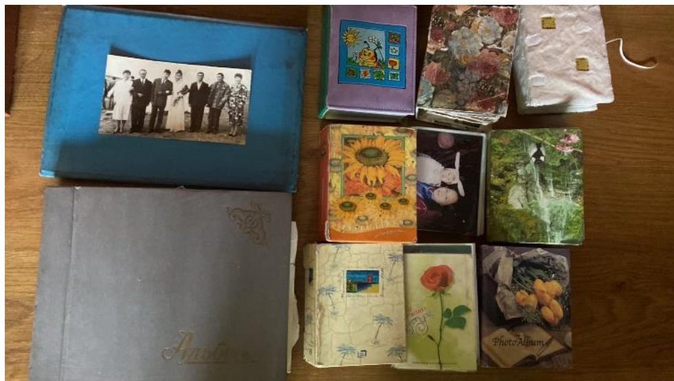
Рис. 3. Стандартный набор фотоальбомов тувинской семьи Figure 3. Standard set of photo albums of a Tuvan family

Количество фотоальбомов. Сегодня практически у каждой тувинской семьи есть целые наборы фотографий в альбомах разных лет (рис. 3). Причем альбомы персонифицировались, делились на периоды жизни (детство, школьные годы, студенчество, семейная жизнь, воинская служба).