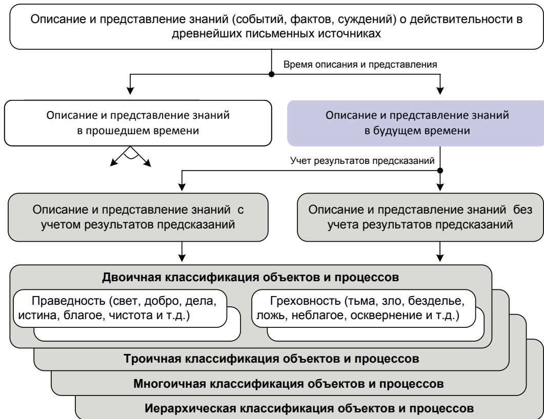
Рис. 3. Систематизация знаний, изложенных в древнейших письменных источниках

К сожалению, следует отметить, что современные отечественные и зарубежные исследователи древних текстов так и не поняли сущности системного описания и представления знаний древними мыслителями. Так, говоря о специфике и сложности перевода сохранившихся древних текстов Авесты, и особенно Видевдата, в частности, отмечается значительное количество «классификаций, которыми изобилует текст» [2. С. 27, 63].