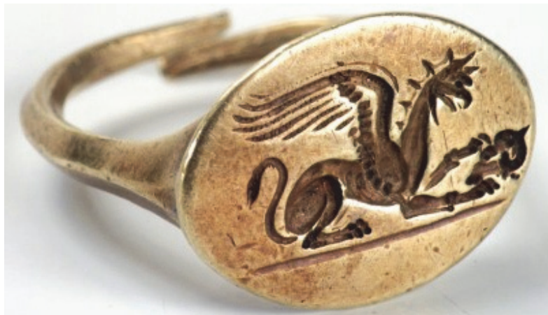
Рис. 7. Золотой перстень с изображением грифона – символа власти Великой Скифии-Руси. Пятибратный курган № 8, IV в. до н.э. Fig. 7. Golden ring with the image of a griffin – a symbol of the power of Great Scythia-Rus. Five-time barrow no. 8, IV century. BC.

Из древнегреческих писаний и преданий чудовищные птицы с орлиным клювом и телом льва называли «собаками Зевса», так как их основная функция была стеречь золото в стране гипербореев – прародине Великой Скифии-Руси. Следует отметить также древнегреческого историка Геродота, который среди древних обитателей севера упоминает гипербореев и грифонов.