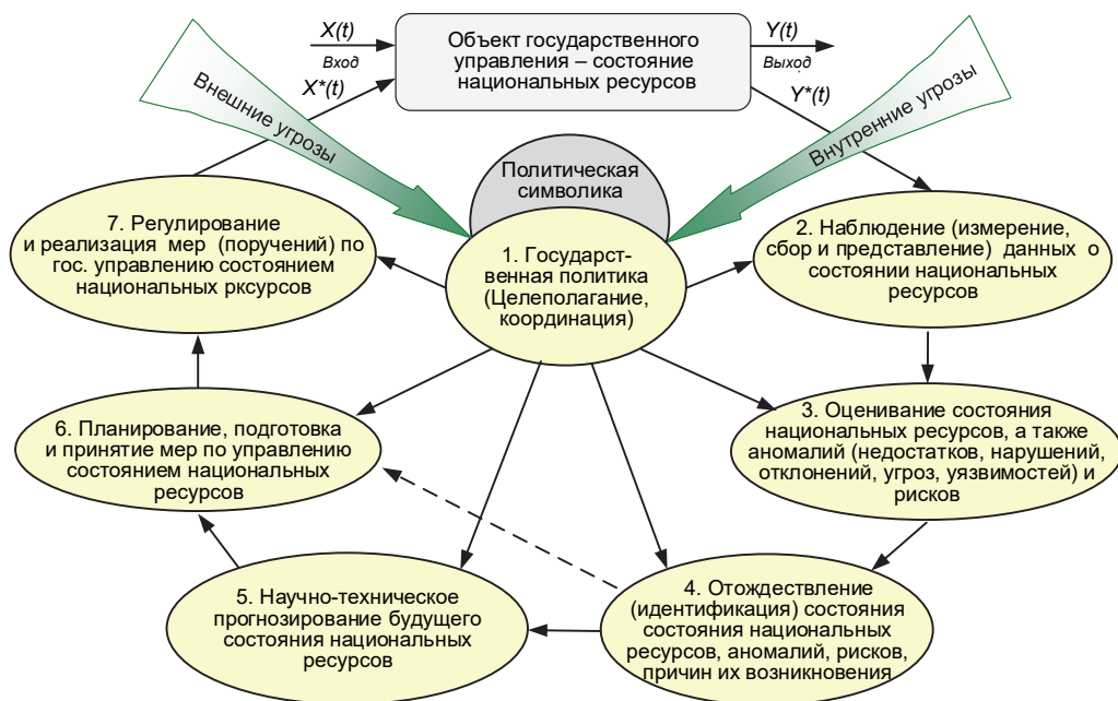
Рис. 1. Инвариантная структура типового контура государственного управления состоянием национальных ресурсов

ресурсов. Необходимые прямые и обратные связи, показанные на рисунке, определяются особенностями реализации отдельных функций государственного управления состоянием национальных ресурсов.