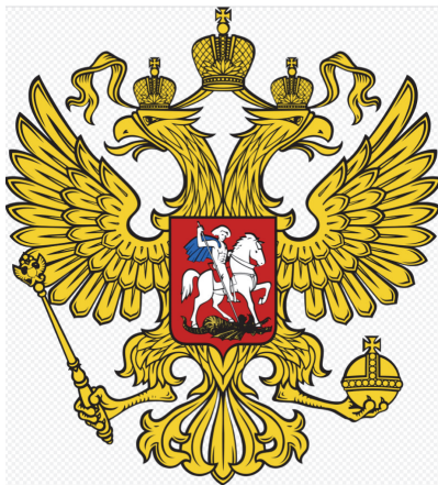
Рис. 2. Двуглавый орел герба России без геральдического щита Fig. 2. Double-headed eagle of the coat of arms of Russia without a heraldic shield

стала Византия. Великий князь московский Иван III Васильевич принял этот герб для России после своей женитьбы на племяннице последнего византийского императора в качестве политического наследия Византии после гибели последней [13]. Однако этот знаковый символ чеканился на монетах Тверского княжества еще задолго до появления в Москве Зои Палеолог, в Византии же «двуглавый орел» никогда не являлся властным символом, а зафиксирован лишь как орнаментальный знак. Поэтому загадка появления «двуглавого орла» в символике нашего Богом, хранимого Отечества и сегодня остается загадкой.