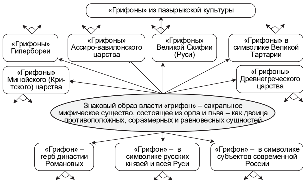
Рис. 6. Знаковый образ «грифон» в символике стран мира индоевропейской общности Fig. 6. The iconic image “griffin” in the symbolism of the countries of the world of the Indo-European community