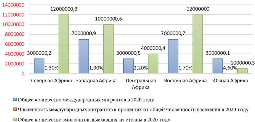
Рис. 3. Общее количество международных мигрантов к середине 2020 г. в Африке Fig. 3. Total number of international migrants by mid-2020 in Africa

– общее количество международных мигрантов к середине 2020 г. в Южной Африке составляло 3,1 млн, доля международных мигрантов от общей численности населения – 4,6% и общее количество эмигрантов, покинувших страну, – 1,3 миллиона.