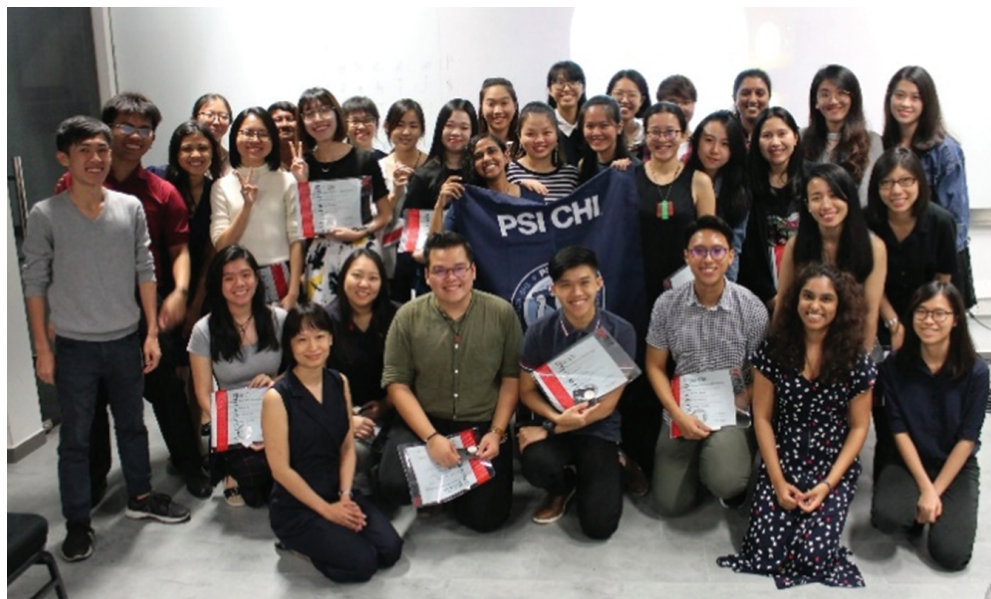
Figure 12. Induction Ceremony and Game Night (January 2019)