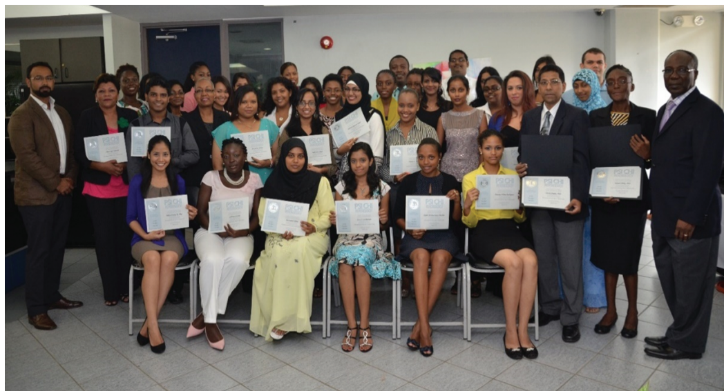
Figure 9. The UWI St. Augustine Campus Psi Chi Chapter Installation Ceremony

4. Since 2013, The UWI Chapter has developed five unique activities.