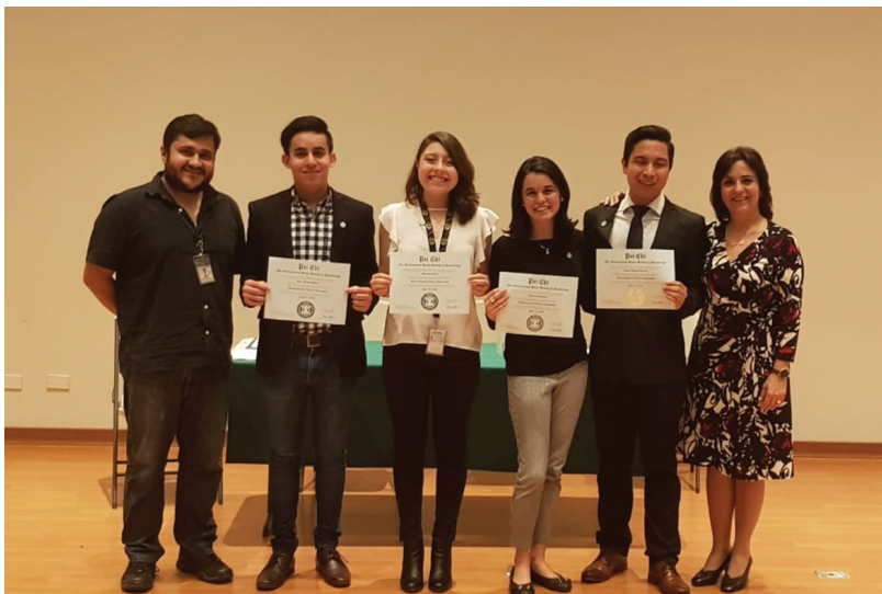
Figure 7. 5th Anniversary of the Latest Psi Chi Chapter in Guatemala on July 20, 2018

2. UVG was the first university in Latin America to install a Psi Chi Chapter, in the year 2012 after two years of preparation. For the past six years there have been four different inductions, accounting for more than 40 Psi Chi members (Figure 7).