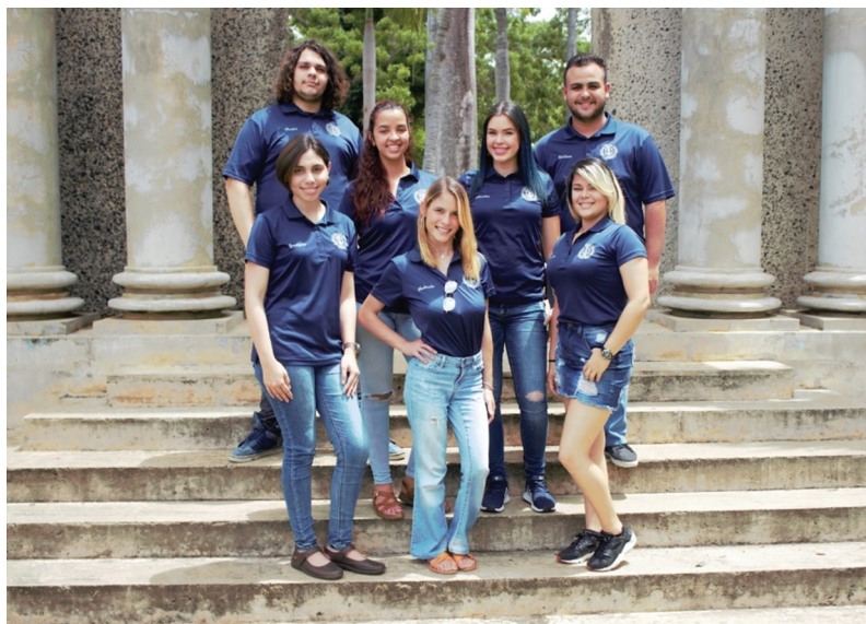
Figure 2. Current Board of Directors of UPR-M Psi Chi Chapter

4. In our chapter, we conceive community service as an integral part of the activities to be accomplished. The purpose is for members to have an experience beyond the academic realm and apply what they have learned to a real-world context. To accomplish this objective, we carried out several community service activities.