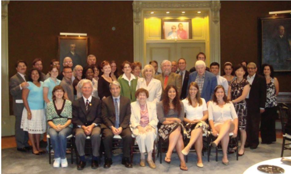
Figure 6. In 2009 at Yale, celebrating 80 years of Psi Chi

Thanks to their youthful determination in 1929, tens of thousands of student and faculty lives have been touched across the USA, and now the world.