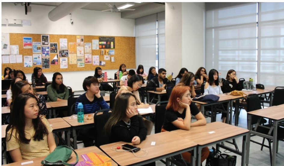
Figure 13. Sexual Harassment Awareness Talk (February 2019)