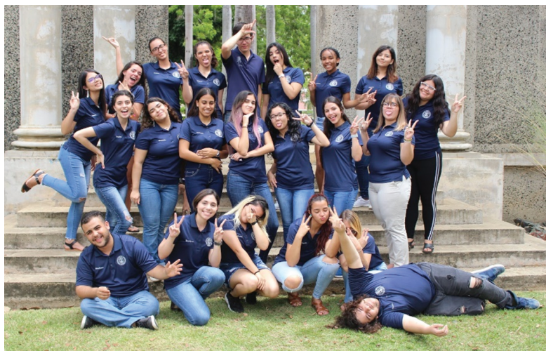
Figure 3. New members of UPR-M Psi Chi Chapter