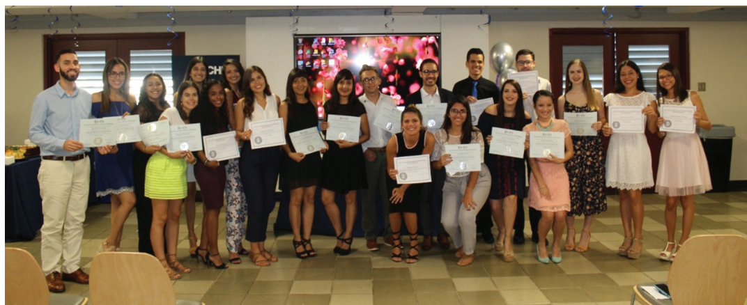
Figure 5. Introduction ceremony at UPR-RP Psi Chi Chapter, 2018