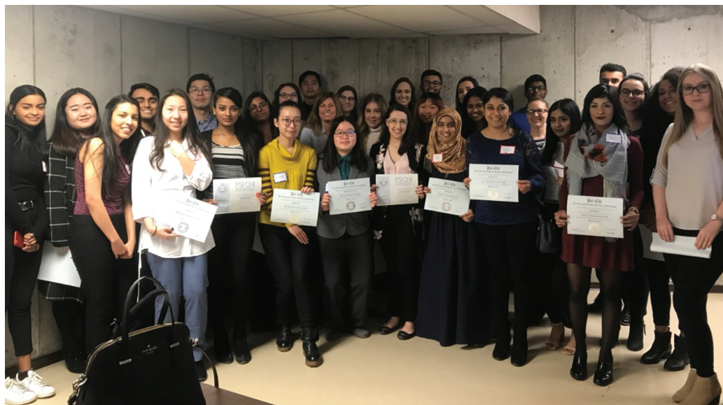
Figure 14. Inaugural Induction Ceremony for the University of Toronto Scarborough's Psi Chi Chapter in March of 2018