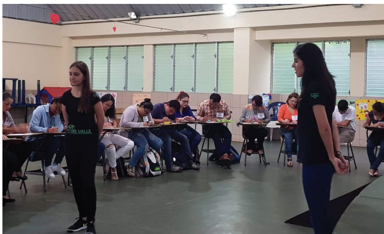
Figure 8. Psi Chi Chapter Staff Working with Those Affected by Natural Disasters

5. For the future, the Guatemalan Chapter is committed to increase and expand international collaborations with Central America, the Caribbean, and other university Chapters in other regions of the world. Expand the outreach and membership of the Chapter in Guatemala. Another plan is to participate in conferences and congresses not only as attendees but as professionals. Lastly, it is also a plan to earn grants to expand the field of Psychology in Guatemala.