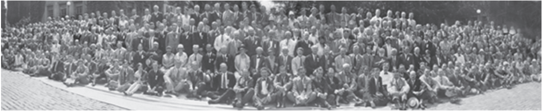
Figure 2. In 1929, the Ninth International Congress of Psychology at Yale University

By its fifth anniversary in 1934, Psi Chi had 612 individual members in 27 chapters. By its tenth anniversary in 1939 at Stanford, it chartered 34 chapters, then 69 chapters by 1949 in Denver.