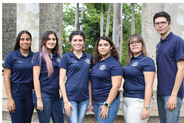
Figure 4. New Board of directors of UPR-M Psi Chi Chapter