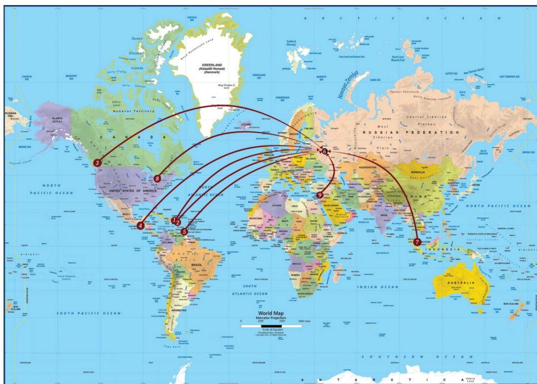
Figure 1. World map 1 with 9 international Psi Chi Chapters that presented their reports:

1 — University of Puerto Rico of Mayagüez (Puerto Rico); 2 — University of Puerto Rico at Rio Piedras (Puerto Rico); 3 — University of British Columbia (Canada); 4 — University of the Valley of Guatemala (Guatemala); 5 — University of the West Indies (Trinidad and Tobago); 6 — Peoples Friendship University of Russia (RUDN University) (Russia); 7 — HELP University (Malaysia); 8 — University of Toronto Scarborough (Canada); 9 — University of Nicosia (Cyprus)