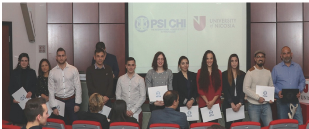
Figure 15. UNIC Installs its Psi Chi Chapter in Cyprus on January 31, 2018