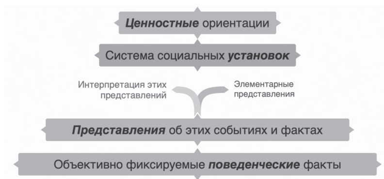
Модель исследования поколенческой относительности оценки взрослости

Уровневая логика модели исследования ПООВ (рисунок) объясняет всю бессмысленность поиска психологических коррелятов формирования взрослого статуса: ведь та же ценность индивидуализма-коллективизма (уровень IV), создающая систему установок и в карьере, и в отношениях с родителями, и в семейном поведении (уровень III) заставляет все поколения понимать осознанность (уровень II) как личностный критерий взросления по-разному: для одних она будет оправданием периода удлинённого детства, а для других – объяснительным инструментом принятия быстрых и иногда, напротив, слишком ранних решений на пути к ранней взрослости. В этом и проявляется пресловутая относительность , заложенная в название этой модели. Одни и те же поведенческие проявления, а также стоящие за этими проявлениями системы установок и ценности могут диаметрально противоположно интерпретироваться разными поколениями. С нашей точки зрения, базовым контекстуальным фактором, влияющим на восприятие конкретного поколения, можно назвать степень объективного экономического и политического благополучия, в котором оно созревает. Связанными социально-психологическими факторами, обуславливающими поколенческую оптику в вопросах взросления можно назвать доминирование: 1) индивидуалистических или коллективистических; 2) либеральных или патерналистских; 3) рационально-прагматических или романтически-духовных ценностей.