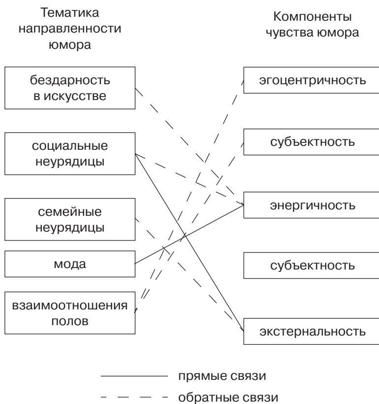
Рис. 3. Специфические корреляции переменных чувства юмора с тематическими конструктами ТЮФ (зрелый возраст)

Интересно, что сочетание в структуре чувства юмора у представителей данной возрастной группы выраженных параметров субъектности и осмысленности определяет зону «апперцептивной слепоты» по отношению к шуткам над человеческой глупостью. Активные «шутники» (энергичность динамического компонента чувства юмора) плохо понимают шутки на тему карьеры, а молодые люди со сниженным желанием шутить (аэнергичность БТЧЮ) — игнорируют юмор, связанный с темой моды, самоутверждения за счет обладания внешними атрибутами социального успеха.