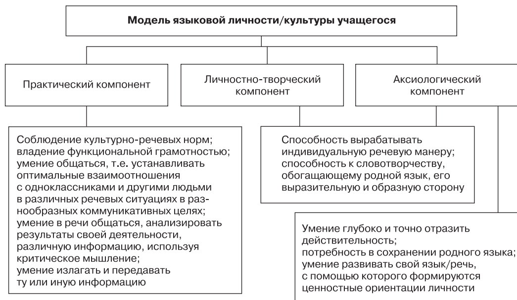
Рис. 2. Модель языковой личности учащегося [1. С. 10]

Работа по формированию языковой личности продолжается в средней школе. Например, в середине II триместра мы проводим диагностическую работу по русскому языку, предлагая учащимся записать по памяти выученный наизусть текст. Список текстов определяется заранее (мы выбираем их из перечня произведений, предназначенных для заучивания на уроках литературы), утверждается на заседании и размещается на школьном сайте.