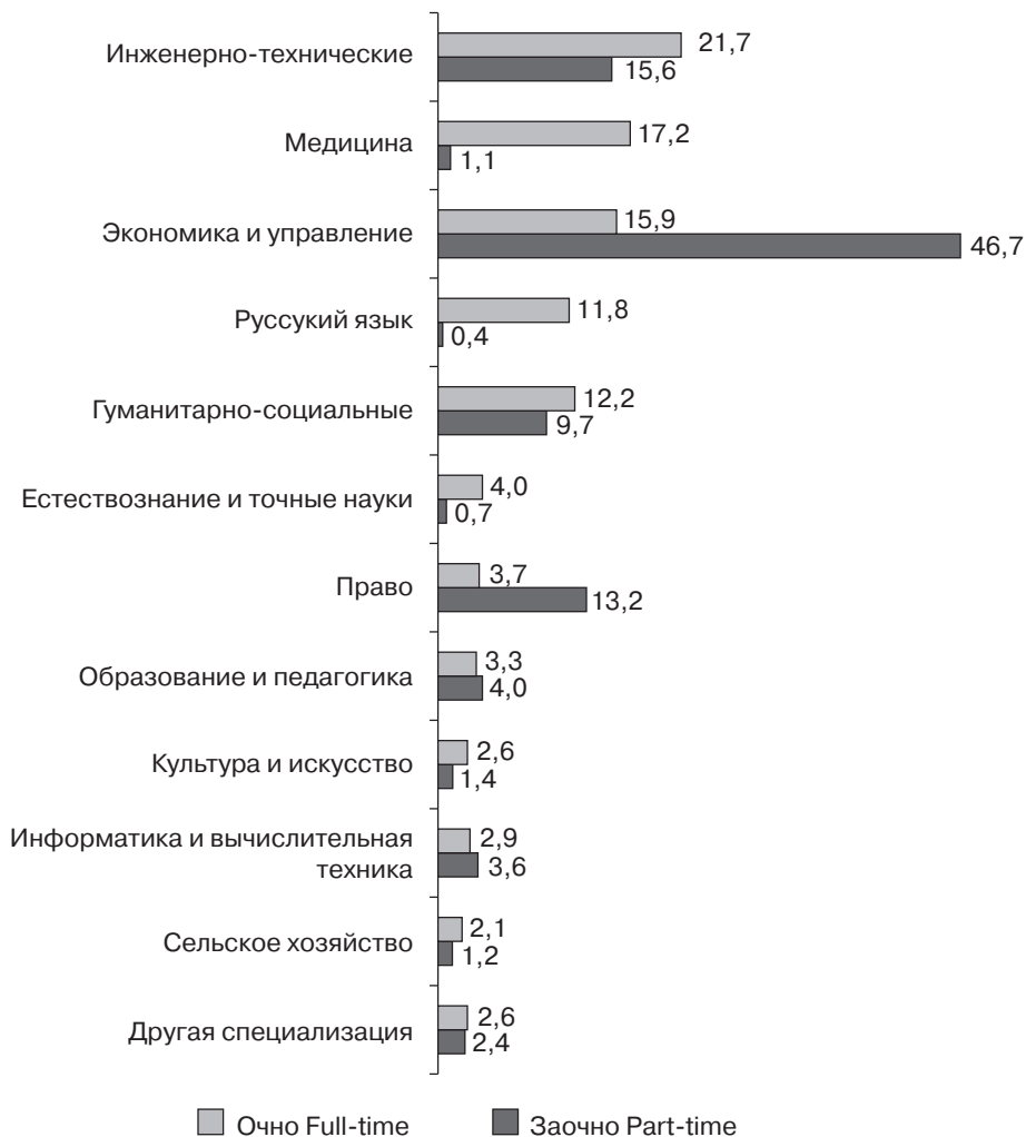
Рис. 1. Специальности, изучавшиеся иностранными гражданами очно и заочно в российских вузах в 2014/2015 академическом году (%)

Рассмотрим статистику по изучению русского языка иностранными гражданами в отечественных вузах и место (востребованность) русского языка среди других изучаемых ими специальностей (рис. 1).