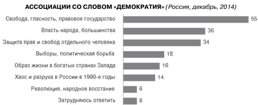
Рис. 2. Динамика социальной трансформации современной России в социально-экономическом, политическом, социокультурном и этнорелигиозном контекстах» (N = 4000)

Закрытая политическая система является серьезным препятствием для процессов демократизации страны и создания в ней эффективного гражданского общества. Вместе с тем социологические исследования свидетельствуют о том, что в целом в обществе присутствуют представления о демократии как системе, гарантирующей определенные политические свободы и правовое государство (рис. 2).