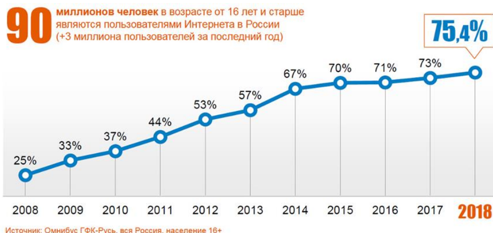
Рис. 1 / Fig. 1 Проникновение Интернета в России / Spread of the Internet in Russia 90 millions elder than 16 use Internet in Russia (+3 millions of users last year)

Проникновение Интернета среди молодежи и людей среднего возраста близко к предельным значениям, и рост аудитории Интернета происходит в основном за счет людей старшего возраста