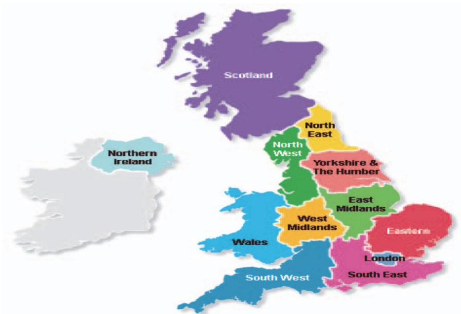
Fig. 1. The nine regions in England and Wales, Scotland and Northern Ireland

South Yorkshire, Tyne and Wear, West Midland and West Yorkshire. Each one covers a large urban area, typically with populations of 1.2 to 2.8 million; the six metropolitan counties are divided into 36 metropolitan districts covering the crowded populated urban areas [2. P. 3].