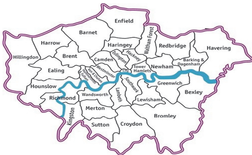
Fig. 3. Map of London Boroughs

In all, there are 32 boroughs in the City of London, each with their own local government, school centers, suburbs and proud sense of identity and history. Each borough has a representative in Parliament. The boroughs are divided into five groups: the Inner East and South, Inner West, Outer South, Outer West, North West, and Outer East and North East [12. P. 9].