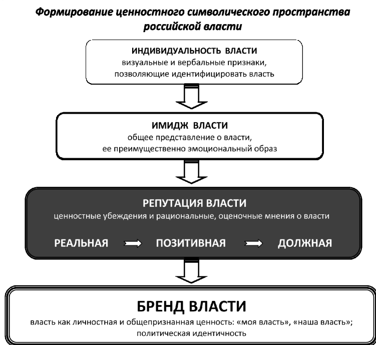
Рис. 1. Процесс формирования ценностного символического пространства.

При разработке процесса формирования ценностного символического пространства российской власти мы основывались на исследовательских подходах признанных исследователей и специалистов-практиков Грэма Даулинга [7] и Томаса Гэда [8]. На рис. 1 представлена принципиальная схема формирования ценностного символического пространства российской власти, единая для всех ее уровней, в том числе и для региональной власти, являющейся особым предметом нашего исследования (1).