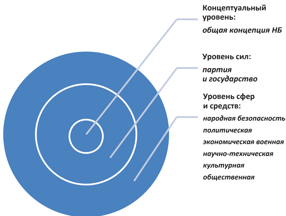
Рис. 1. Система обеспечения национальной безопасности КНР

Итак, СОНБ Китая, по данным сайта «Единого дня просвещения в области национальной безопасности» (全民国家安全教育日 Цюаньминь гоцзя аньцюань цзяоюй жи ), представляет собой систему, которая схематично представлена на рис. 1.