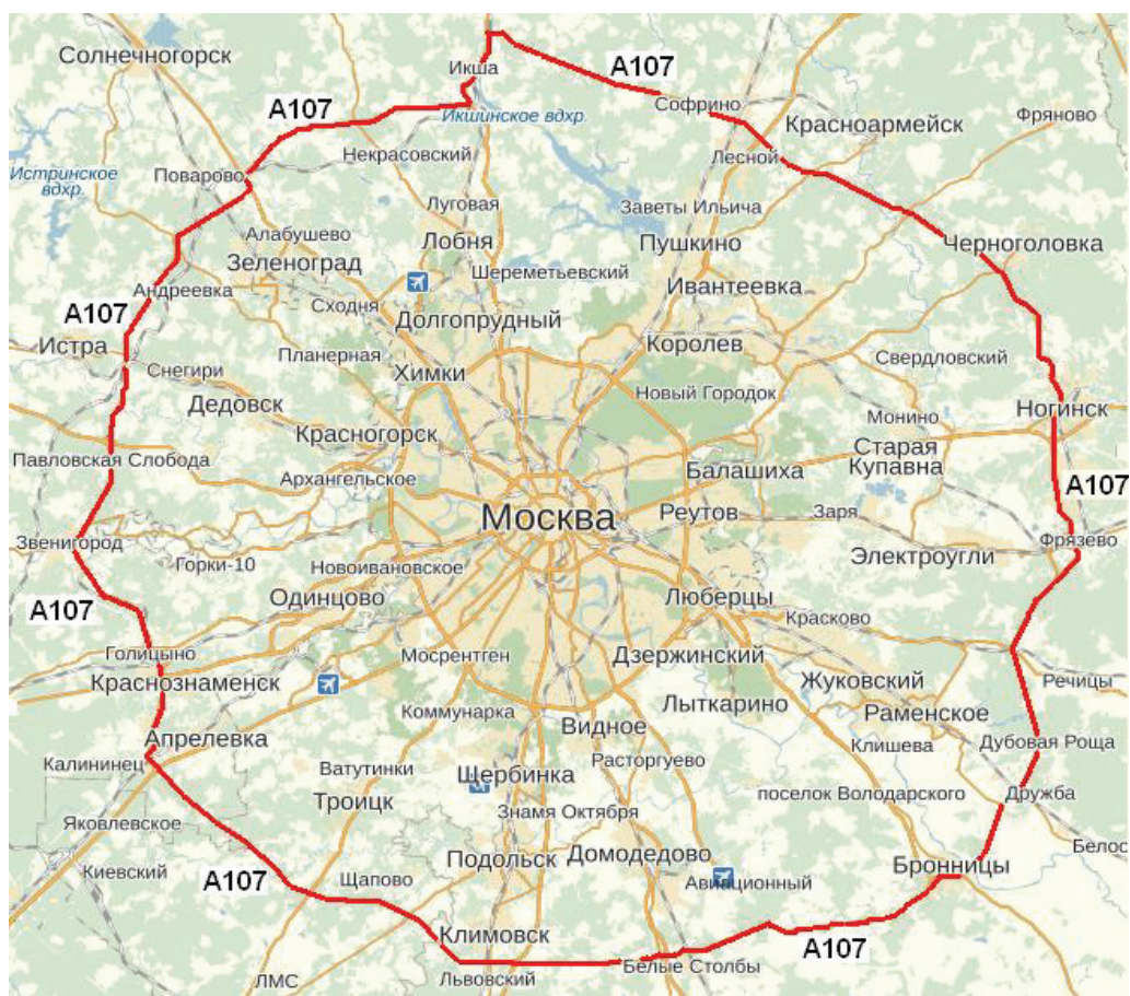
Рис. 1. Вариант расширения Москвы до ММК

3) присоединение к Москве отдельной, специально выделенной территории Московской области.