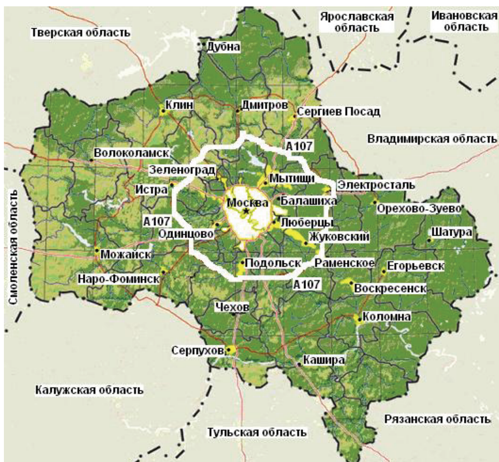
Рис. 2. Территория Московской области

Если воспользоваться бюджетными показателями, приведенными в Законе Московской области от 12.12.2013 № 152/2013-ОЗ «О бюджете Московской области на 2014 год и на плановый период 2015 и 2016 годов» [8], то путем несложных вычислений легко показать, что из всех муниципальных районов и городских округов, расположенных в пределах ММК, являются самодостаточными либо производят отчисления в бюджет Московской области 62% муниципальных образований, включая те из них, на территории которых находятся упомянутые нами гипермаркеты и другие торговые объекты вдоль внешней стороны МКАД. За пределами ММК таких муниципальных образований оказывается только 10%, соответственно, все остальные являются дотационными, т.е. получают отчисления из бюджета области. При этом на остающихся за пределами ММК примерно 85,5% площади Московской области проживают порядка 60% населения субъекта федерации. Очевидно, что бюджетные показатели области — явно не в пользу подобного изменения границ.