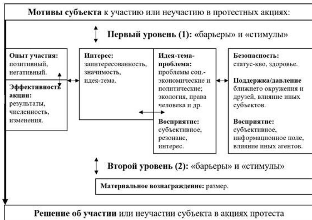
Рис. 1. Мотивы субъекта, принимающего решение об участии в протестных акциях

По итогу фокус-групп респонденты разделились на две категории. Одна состоит из людей, которые вообще не имеют установок на протестное поведение (не менее 50 %). Вторая совокупность респондентов образована молодежью, допускающей для себя возможность протестного поведения при соблюдении определенных условий (39 %). В качестве таковых, во-первых, выступает беспокойство по поводу расширения функций правительства и полного контроля власти над социумом, «ужесточения» политического режима и превращения государства в полицейское, когда на то, «чтобы открыть холодильник, ...ты спрашиваешь разрешение» (В.ДФО), а также ограничения персональных прав и свобод молодых людей, их возможности самореализовываться: «Если у нас, как в Северной Корее, решит Правительство ограничить свободу, то я выйду» (В.ЗК; С.ДФО и др.). Во-вторых, наличие угрозы статусу родственников, знакомых опрошенных, личности самого информанта или социально-экономических проблем у них: «задержка зарплат, субсидий, пособий» (Ш.АК; В.ДФО и др.). В-третьих, требуется совпадение темы протеста с интересами интервьюируемого: «Например, сейчас я бы вышла против пенсионной реформы...» (Ш.РБ; С.РТ). Кроме того, не исключена материальная заинтересованность: «...если бы деньги заплатили...» (С.АК; С.РТ). При этом основная масса интервьюируемых подчеркивала, что для актуализации их протестных установок необходим связанный комплекс факторов, в конкретный момент влияющий на положение их семьи, страны, на них самих.