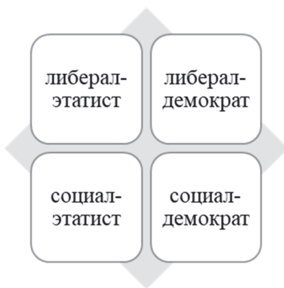
Рис. 1. Положение основных идеологических типов на оси координат (ось Y – отношение к экономической свободе, ось X – отношение к политической свободе)

Таким образом, выделено два идеологических спектра по политической оси: демократ считает, что интересы государства не должны превалировать частными, а свобода не должна ущемляться из-за проблем безопасности, этатист, в свою очередь, придерживается обратного мнения. Аналогично выделено два спектра в экономической оси: социалист придерживается мнения, что государство должно регулировать экономику, либерал – сторонник рыночных принципов в экономике. На основе этих ниш в статье выделяется четыре основных идеологических типа (рис. 1).