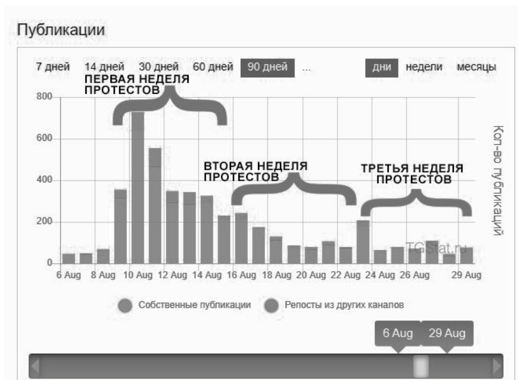
Рис. 1 / Fig. 1

Распределение активности публикаций Telegram-канала «Nexta Live» / Distribution of the activity of publications of the Telegram channel «Nexta Live» Источник / Source: составлено автором на основе данных Telegram Analytics. Nexta Live // Telegram Analytics. URL: https://by.tgstat.com/channel/@nexta_live (дата обращения: 25.11.2020)