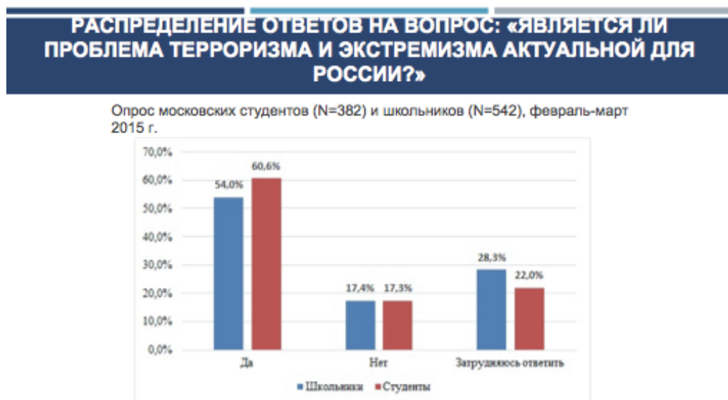
Рис. 3. Распределение ответов на вопрос: «Является ли проблема терроризма и экстремизма актуальной для России?»

Последней темой круглого стола стали темы экстремизма и терроризма, которые на сегодняшний день являются очень опасными феноменами для России. Экспертам была предоставлена следующая статистика: в прошлом году в феврале-марте 2015 г. был проведен опрос среди московских студентов и школьников, и один из вопросов который задавался молодежи — «Является ли проблема терроризма и экстремизма актуальной для России?». Как можно видеть из представленной диаграммы для большинства школьников и студентов, среди школьников 54%, студентов таких 60%, считают, что данная проблема является актуальной (рис. 3).