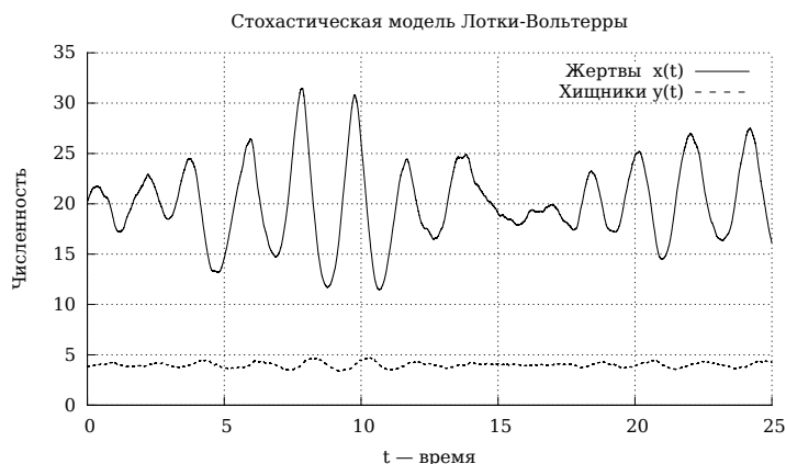
Рис. 4. Стохастическая модель «хищник–жертва»