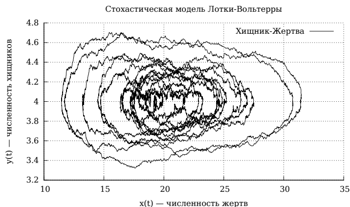
Рис. 3. Фазовый портрет для стохастической модели «хищник–жертва» в окрестности точки (1, 1)

Данное поведение проиллюстрировано на рис. 3. При этом временная зависимость имеет вид, приведённый на рис. 4.