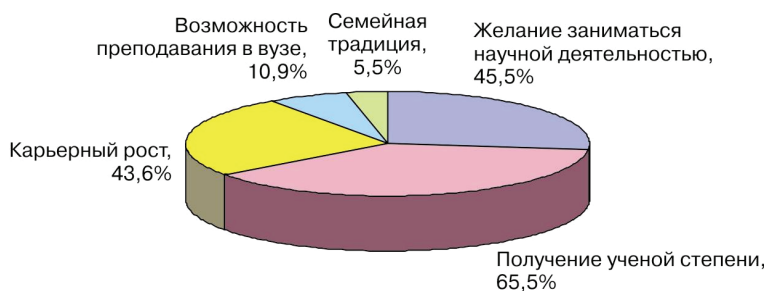
Рис. 2. Результаты анкетирования аспирантов ММА им. И.М. Сеченова январь 2008 года: основная мотивация поступления в аспирантуру (в % от общего числа ответов)