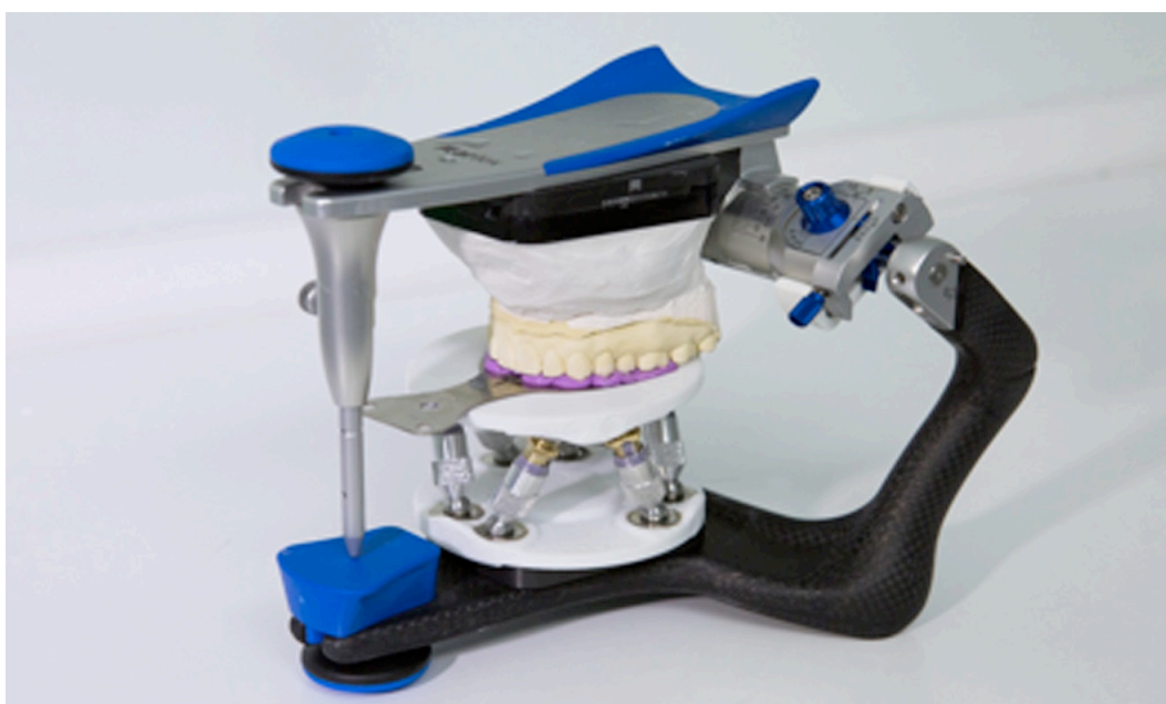
Fig. 1 Mechanical articulator Artex CR (Girschbach)

After the two-layer silicone impressions were removed, the models were gypsum plated using a mechanical facial arc, the movement of the mandible in the mechanical articulator was reproduced using its articular mechanisms. The articulator (articular mechanisms and programmable table) was adjusted