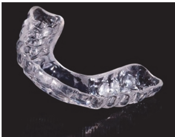
Рис. 2. Разобщающая каппа