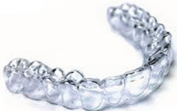
Рис. 4. 3D-каппы

Каппы 3D прочны и устойчивы к окрашиванию. Носить их следует 22 часа в сутки. Средняя продолжительность лечения каппами 3D составляет 18 месяцев. Недостатками 3D капп является необходимость неоднократного повторного их изготовления в процессе лечения (каждые 2 недели, месяц или 2 месяца); длительность лечения, применение только у взрослых; высокая цена.