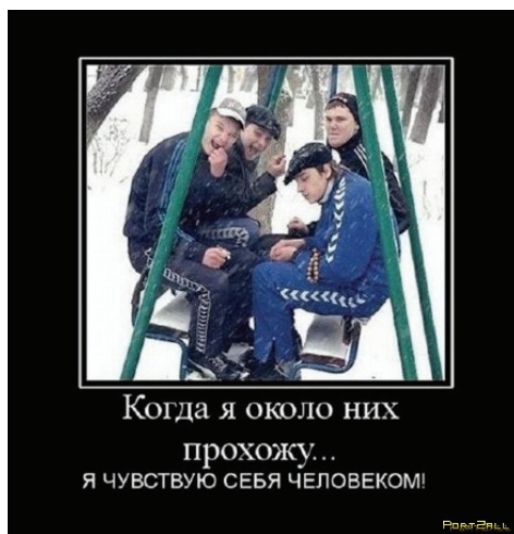
Рис. 3. Вирусное изображение, выполненное в стиле демотиватора [7]

Подобные информация можно типологизировать по степени привлекательности целевых аудиторий: