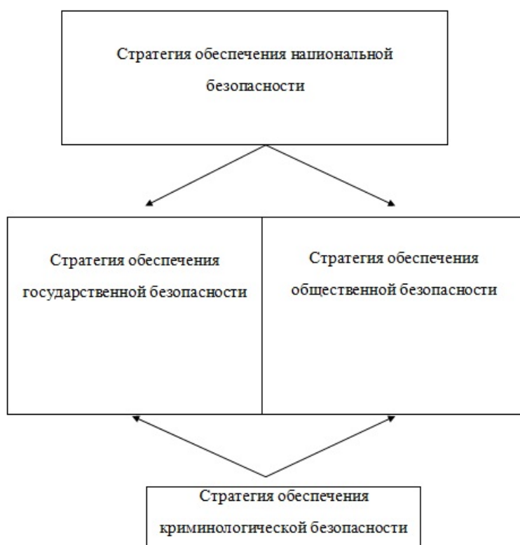
Рис. 1. Соотношение стратегий обеспечения безопасности

Стратегия обеспечения криминологической безопасности является составной частью более глобальных стратегий, таких как стратегия обеспечения национальной безопасности, стратегия обеспечения государственной безопасности и стратегия обеспечения общественной безопасности. Их соотношение схематично выглядит следующим образом (рис. 1).