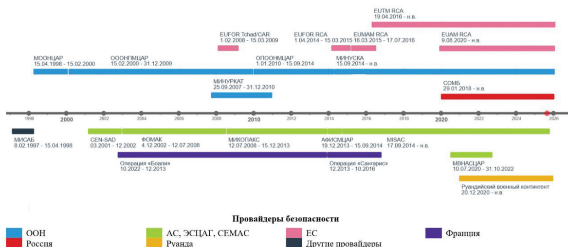
Рис. 1. Международное вмешательство в ЦАР с 1996 г. по наст. вр.

Несмотря на десятки сменяющих друг друга миротворческих операций (рис. 1), внутривластная ситуация в стране пока еще далека от нормализации, что и представляет собой центральноафриканский парадокс безопасности , анализу которого посвящено данное исследование.