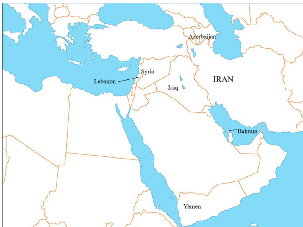
Рис. 1. Зона влияния «иранского полумесяца» (Ливан, Сирия, Ирак, Азербайджан, Бахрейн и Йемен)

есть тот самый «шиитский полумесяц». Другими словами, «иранский», или «шиитский полумесяц», — это влияние и/или присутствие Ирана в Ливане, Сирии, Ираке, Азербайджане, Бахрейне и Йемене (рис. 1). Более того, Тегеран использует «иранский полумесяц» как важный элемент, определяющий геополитические интересы страны. Автор данной статьи не пытается вступить в полемику с экспертами, категорично не принимающими термин «иранский полумесяц» или отрицающими такое явление на Ближнем Востоке. Можно назвать иранский фактор в регионе по-другому, не «шиитским» или «иранским полумесяцем», а просто «иранским серпом», но от этого не изменится тот факт, что на Ближнем Востоке существует серьезный иранский геополитический проект. То есть суть дискуссии заключается не в том, какой термин больше подходит для описания ситуации, а в том, что ИРИ имеет серьезные рычаги влияния и давления в регионе. В целом «иранский полумесяц» основан скорее на геополитических, чем на религиозно-идеологических факторах.