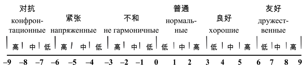
Рис. 1. Стандарты оценки двусторонних отношений / Fig. 1. Standards for assessing bilateral relations