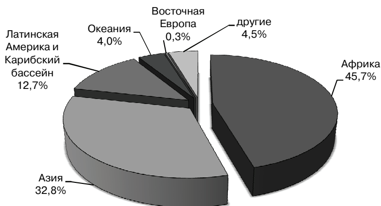
Рис. 2. Региональная структура китайской зарубежной помощи, 2009 Составлено автором по данным [7]

Африканское направление является главным приоритетом политики содействия Китая международному развитию. Растет доля стран Латинской Америки и Центральной Азии. Несмотря на отсутствие детализированной статистики с китайской стороны, эксперты утверждают, что доля стран, обладающих природными ресурсами, неуклонно растет. Согласно Белой книге, около 80% китайской зарубежной помощи в 2009 г. было направлено в страны Африки и Азии (рис. 2).