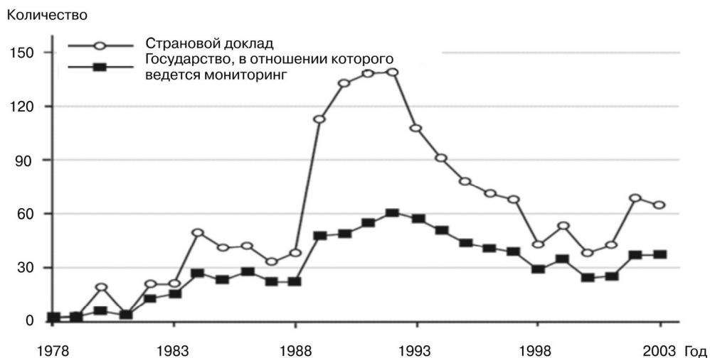
Рис. 2. Динамика количества страновых докладов и стран, в отношении которых ведется правозащитный мониторинг, трех НКО (Human Rights Watch, International Commission of Jurists, Lawyers Committee for Human Rights)