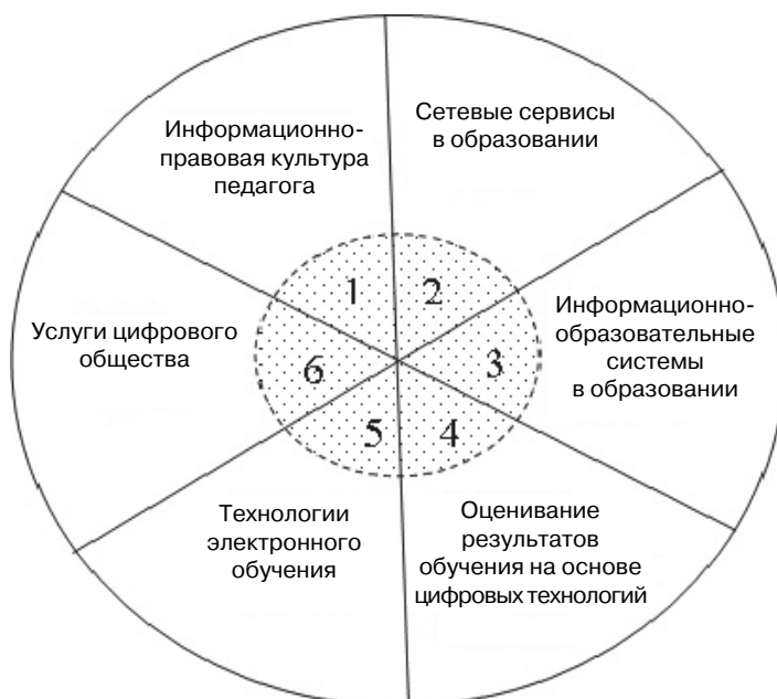
Рис. 2. Соответствие содержания магистерской программы подготовки «Цифровые технологии и сетевое взаимодействие в образовании» примерному профилю цифровых компетенций педагога

Указанные в примерном профиле цифровых компетенций педагога основные знания, умения и навыки позволили нам предложить содержание обу-