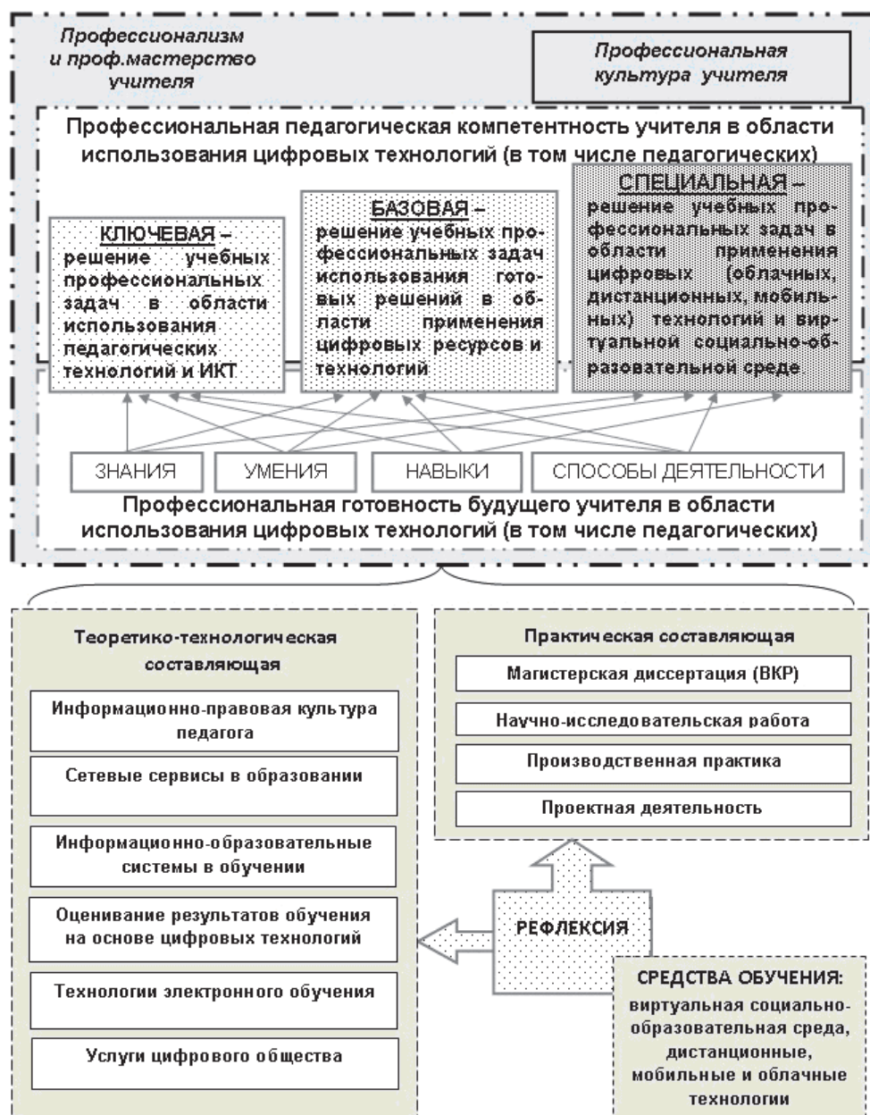
Рис. 3. Составляющие и направления формирования готовности педагога к деятельности в виртуальной социально-образовательной среде на основе развития цифровых компетенций

В данном контексте основная наша цель заключается в отборе учебных задач, соответствующих профессиональным задачам педагога, и выявлении критериев, отвечающих специальному уровню сформированности цифровых компетенций согласно областям применения цифровых компетенций.