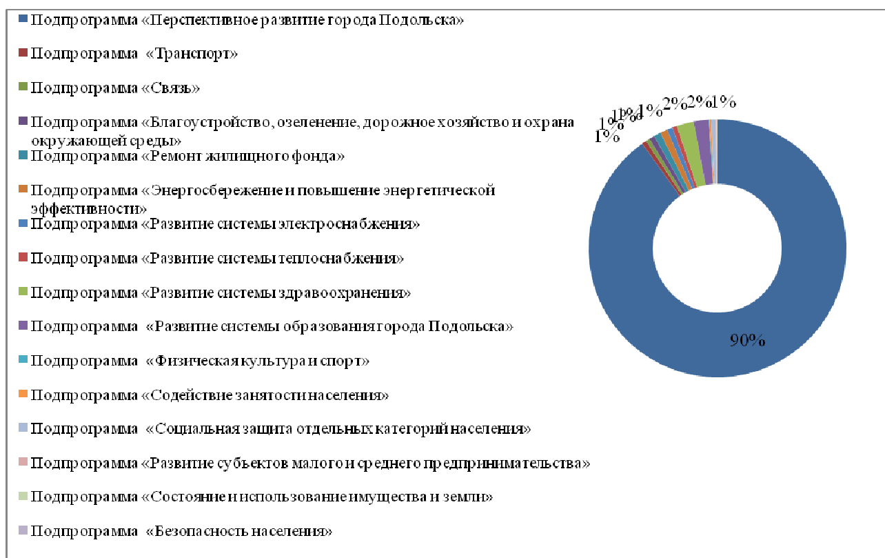
Рис. 1. Распределение финансирования по подпрограммам в соответствии с плановыми значениями 2012 и 2013 гг.

Существует особенность выделения финансовых ресурсов для реализации программы. В 2012-2013 гг. финансирование производилось в разрезе подпрограмм, включенных в программу. С 2014 г. в соответствии с Бюджетным кодексом РФ и Постановлением Главы города Подольска от 28.08.2013 г. №1705-П программа предполагает учет объема необходимых финансовых средств на реализацию мероприятий программы в муниципальных целевых программах.