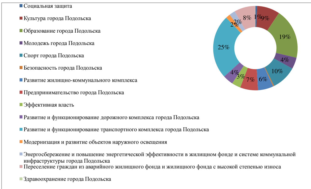
Рис. 2. Распределение финансирования по подпрограммам в соответствии с плановыми значениями 2014 г.

реализовано 16 подпрограмм. Основной объем финансирования направлялся на подпрограмму «Перспективное развитие города Подольска» – 90% (рис. 2).