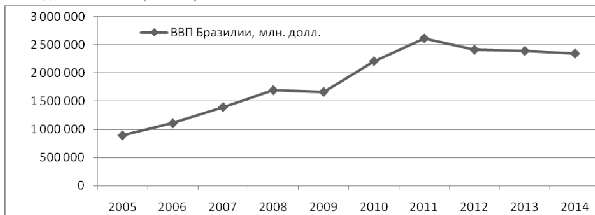
Рис. 1. Динамика ВВП Бразилии в 2005-2014 гг., млн. долл. США

Как видно из анализа представленных данных, за 2005-2014 гг., т.е. за 10 лет, ВВП – основной макроэкономический показатель – Бразилии по стоимости увеличился в 2,6 раза. При этом ВВП Бразилии рос более высокими темпами и достиг более высоких показателей на 2014 г. включительно, чем у России, Индии и ЮАР (но меньше, чем у Китая). В настоящее время по стоимости производимого ВВП Бразилия входит в ТОП-10 крупнейших стран мира, и ее доля в мировом валовом продукте значительно увеличилась за последние 10 лет и достигает 3% (табл. 1).